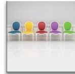
Trend & design